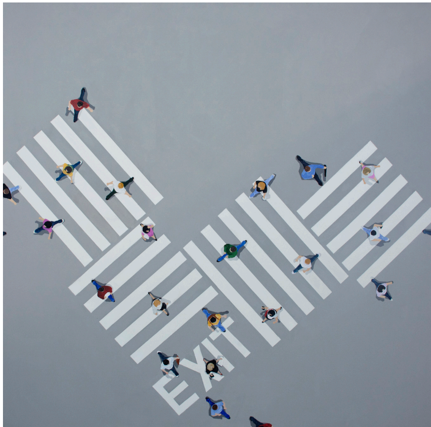
EXIT , 2019 Ακρυλικό σε καμβά 150x150 cm