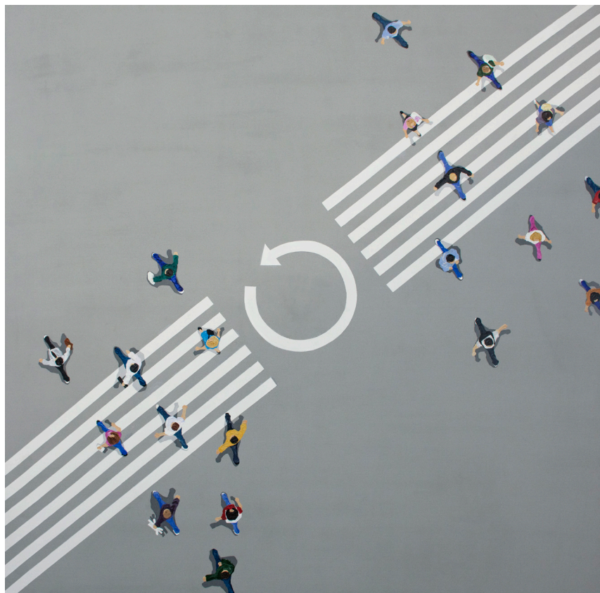
ΕΠΑΝΑΛΗΨΗ , 2018 Ακρυλικό σε καμβά 150x150 cm