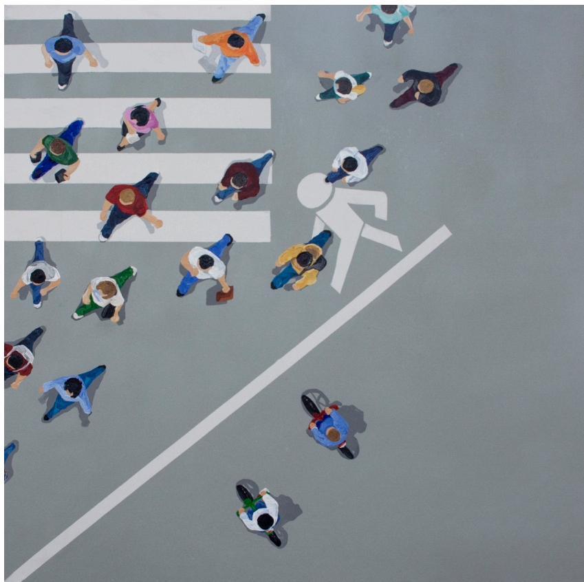
ΟΡΙΑ , 2018 Ακρυλικό σε καμβά 70x70 cm