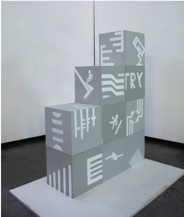
ΧΩΡΙΣ ΤΙΤΛΟ , 2019 Ακρυλικό σε κόντρα πλακέ Μεταβλητή διάσταση