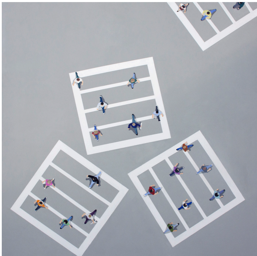
ΣΥΝΟΡΑ , 2019 Ακρυλικό σε καμβά 150x150 cm