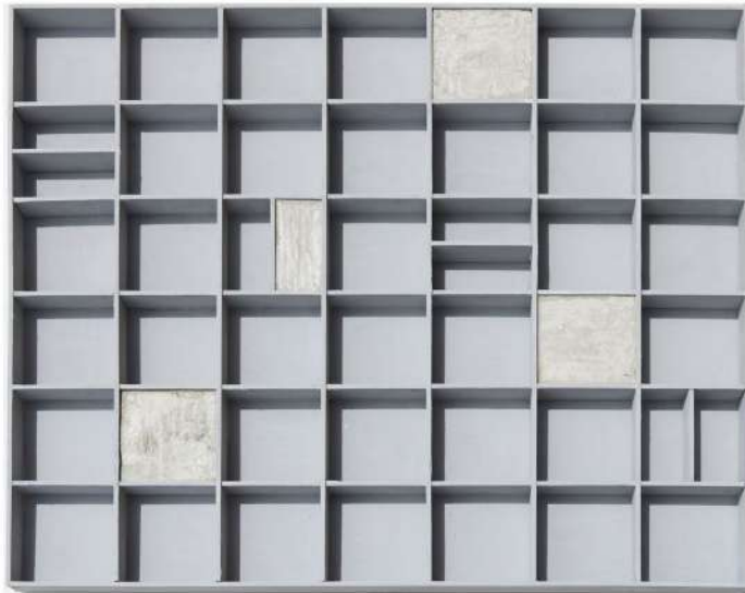
χωρίς τίτλο , 2019 ξύλο, τσιμέντο, ακρυλικά 60x70cm