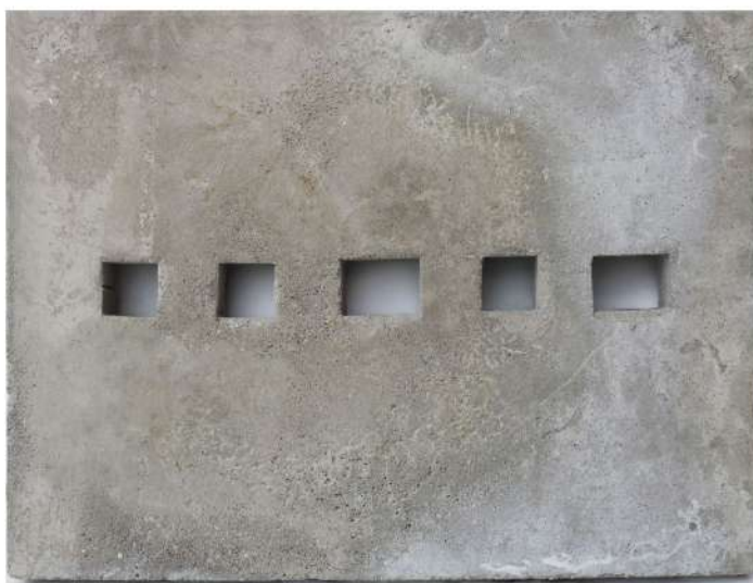
χωρίς τίτλο , 2019 οπλισμένο σκυρόδεμα, ξύλο 50X65cm