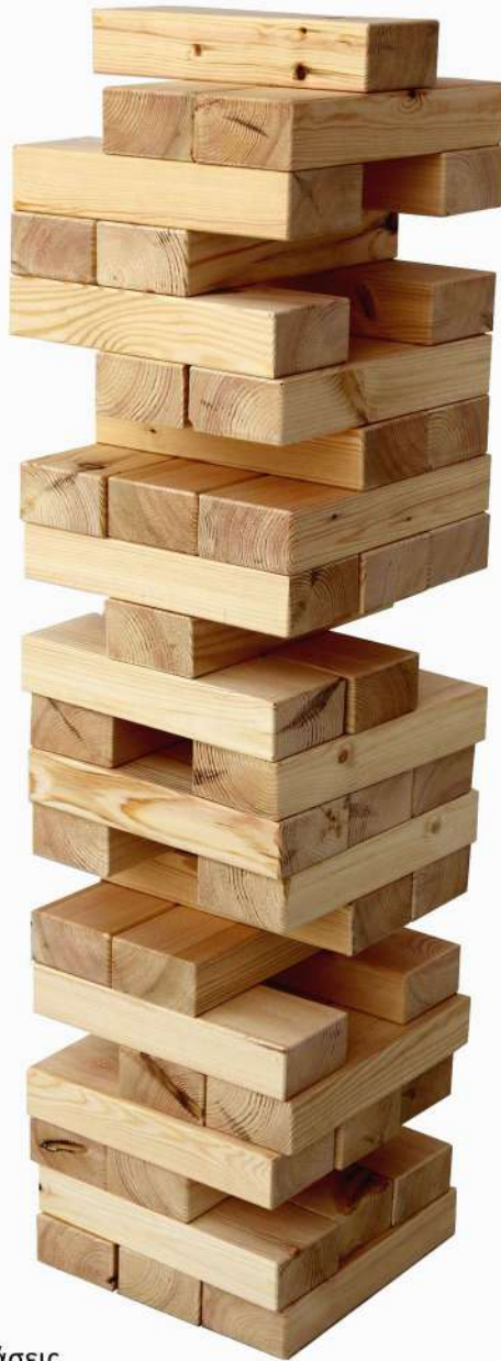
να χτίζεις , 2019 ξύλο μεταβλητές διαστάσεις