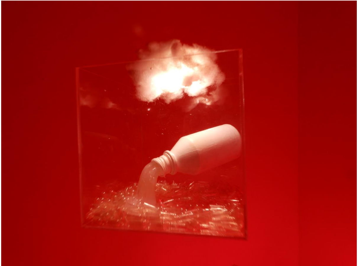
Grotto 2019, λεπτομέρεια εγκατάστασης, mixed media, 20x20 εκ.