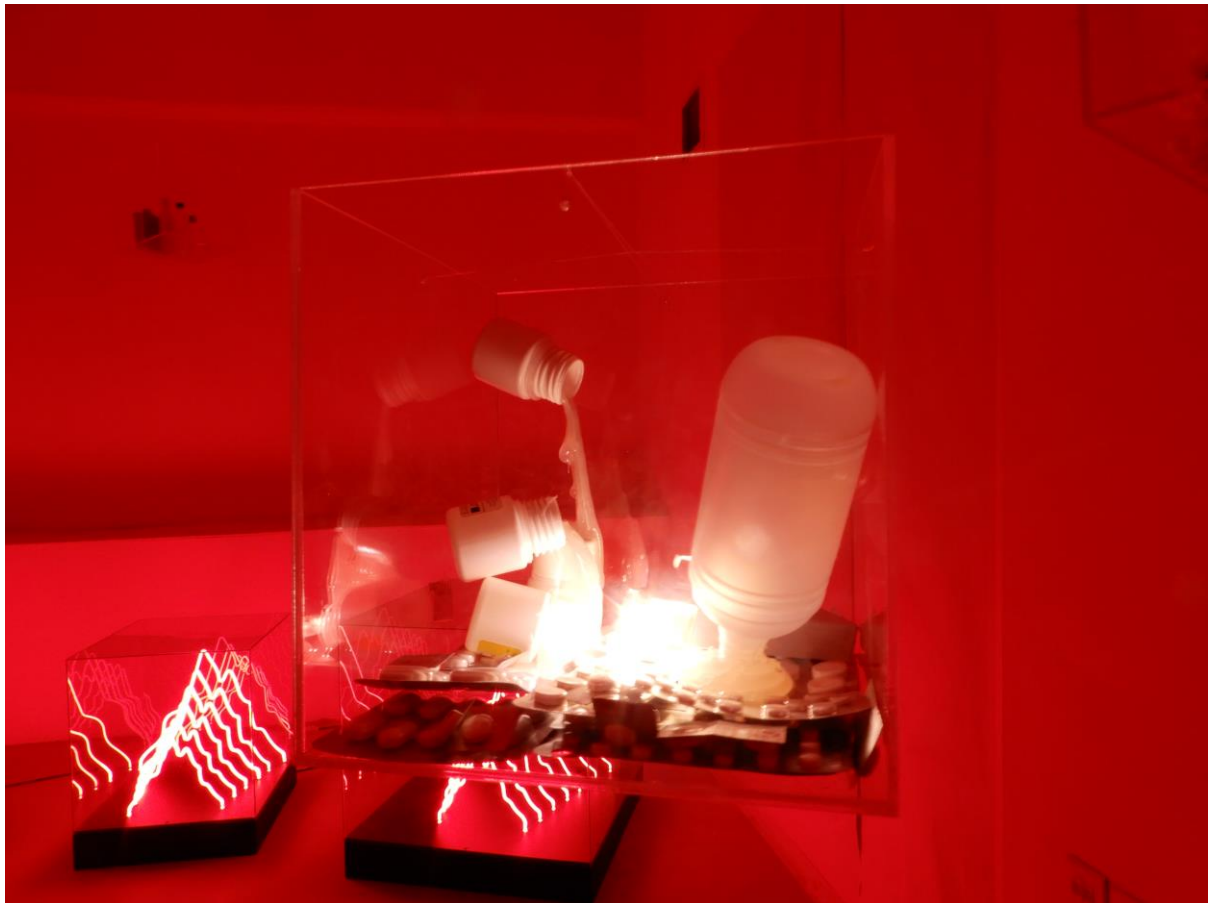
Grotto 2019, λεπτομέρεια εγκατάστασης, mixed media 20x20 εκ.