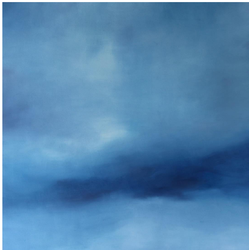
Άπυλο , 2019, λάδι σε καμβά, 100X100 εκ.