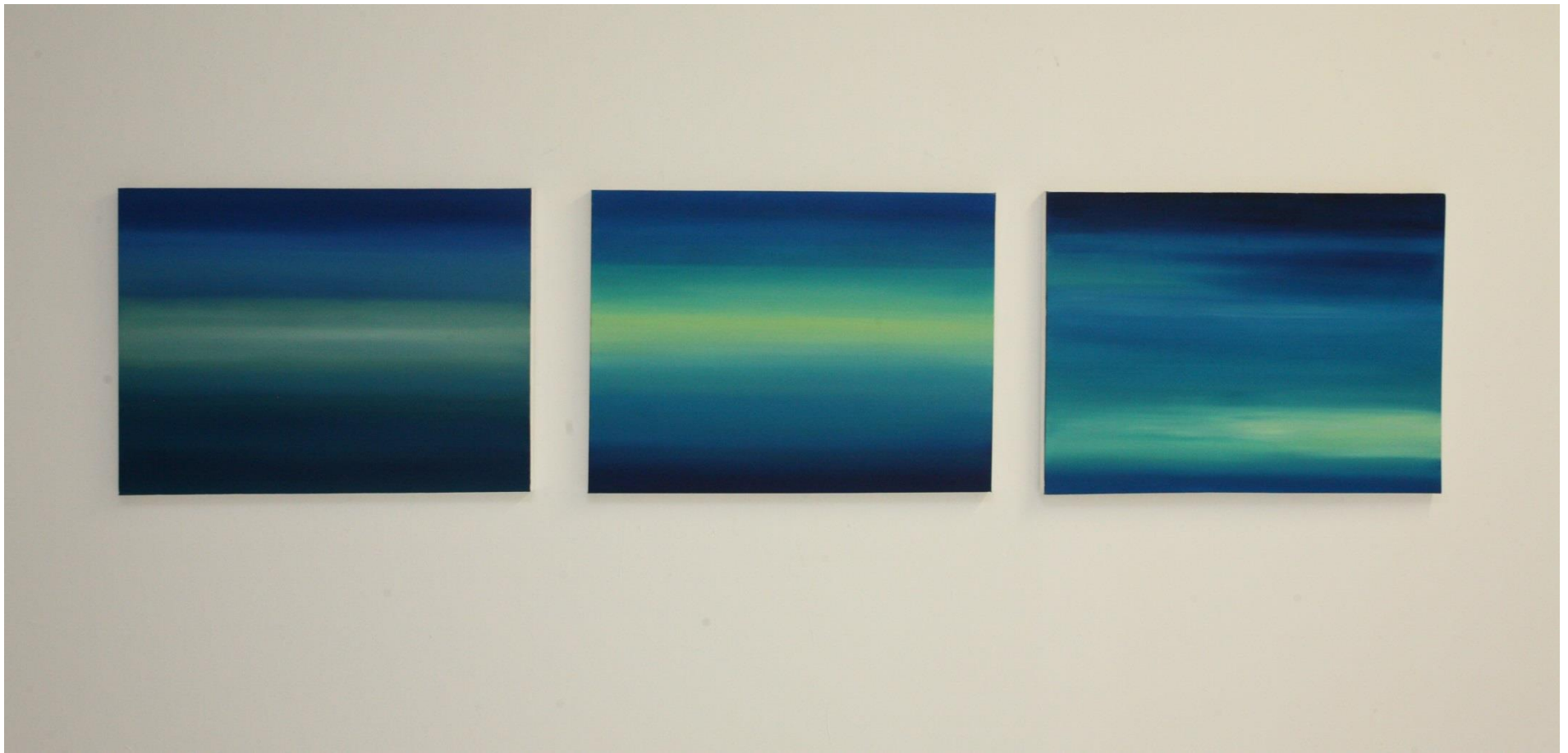
Σύνθεση , 2019