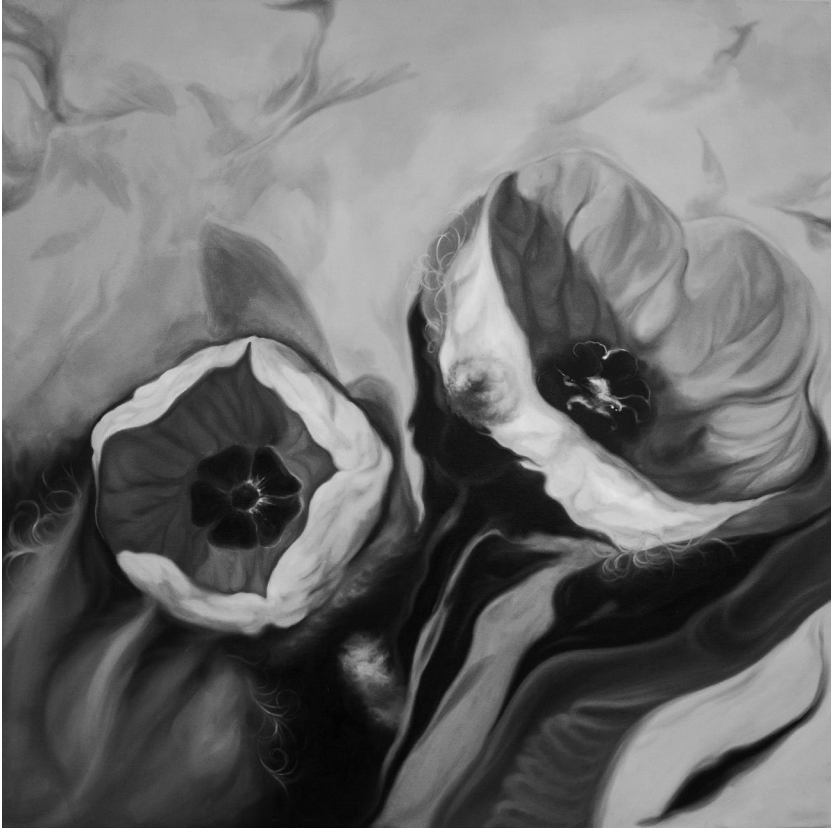
χωρίς τίτλο , 2018, λάδι σε μουσαμά, 100x100 εκ.