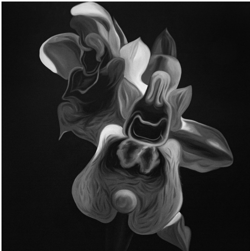
χωρίς τίτλο , 2019, λάδι σε μουσαμά, 100x100 εκ.