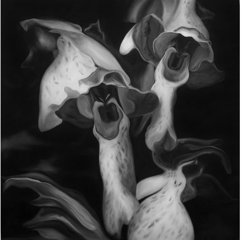
χωρίς τίτλο , 2018, λάδι σε μουσαμά, 100x100 εκ.