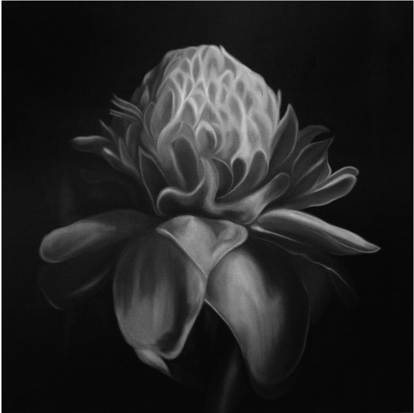
χωρίς τίτλο , 2019, λάδι σε μουσαμά, 100x100 εκ.