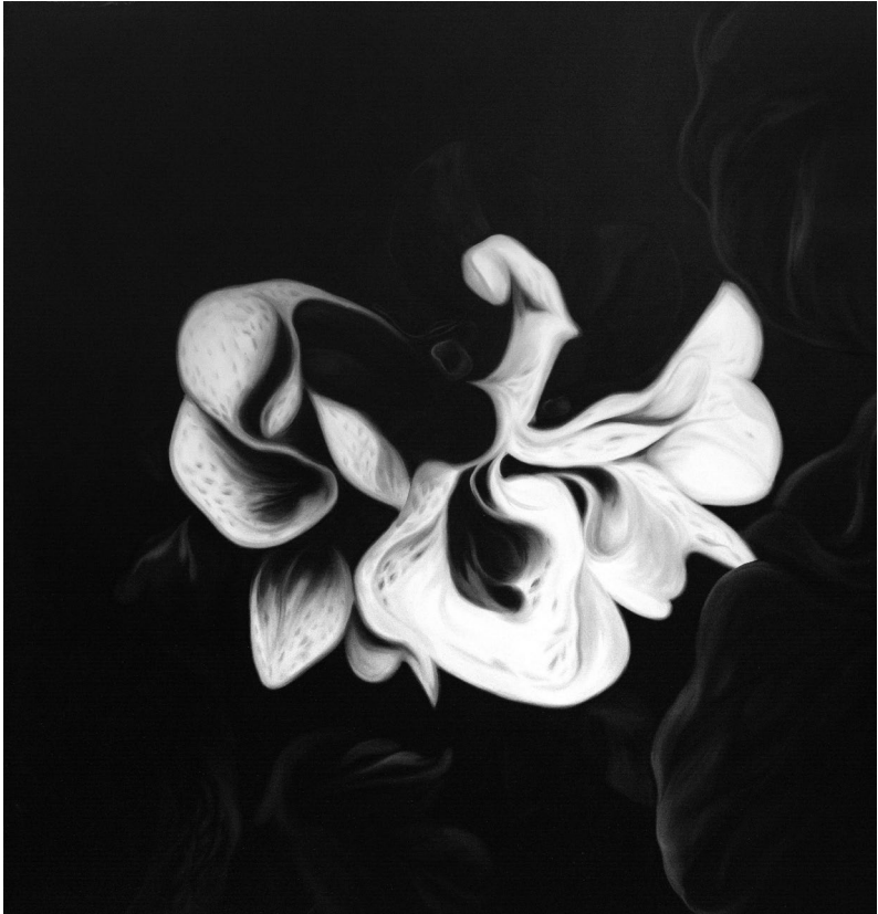
χωρίς τίτλο , 2018, λάδι σε μουσαμά, 100x100 εκ.