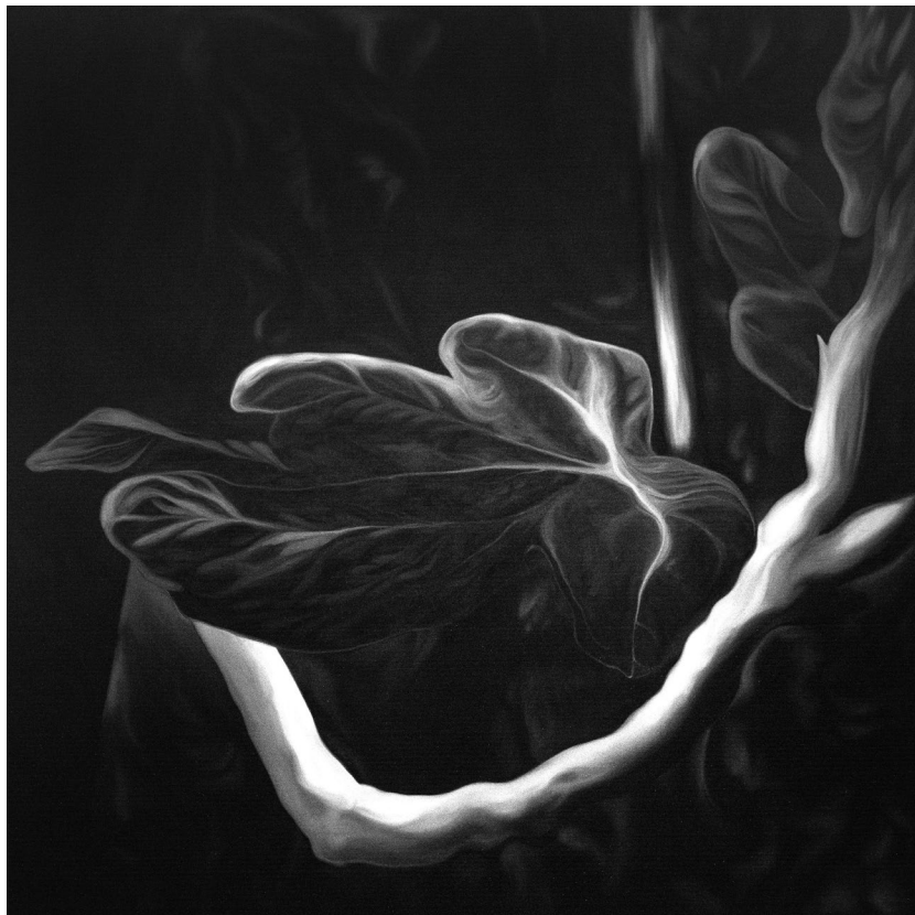
χωρίς τίτλο , 2019, λάδι σε μουσαμά, 100x100 εκ.