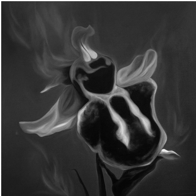
χωρίς τίτλο , 2018, λάδι σε μουσαμά, 100x100 εκ.