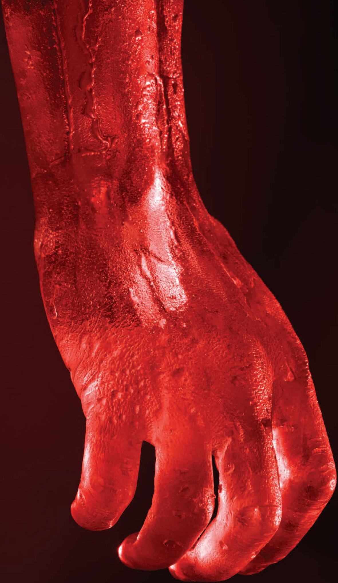
ΣΩΜΑ, ΛΕΠΤΟΜΕΡΕΙΑ, 2019 ΡΗΤΙΝΗ ΔΙΑΣΤΑΣΕΙΣ ΜΕΤΑΒΛΗΤΕΣ