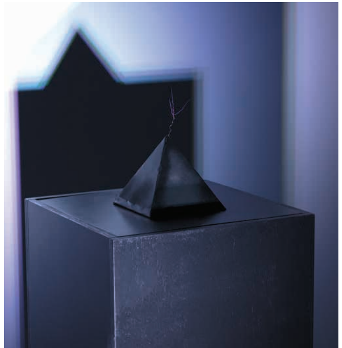
ΝΟΥΣ, ΛΕΠΤΟΜΕΡΕΙΑ , 2019 ΞΥΛΟ, ΛΑΜΑΡΙΝΑ, ΠΗΝΙΟ 40 x 40 x 95 εκ.