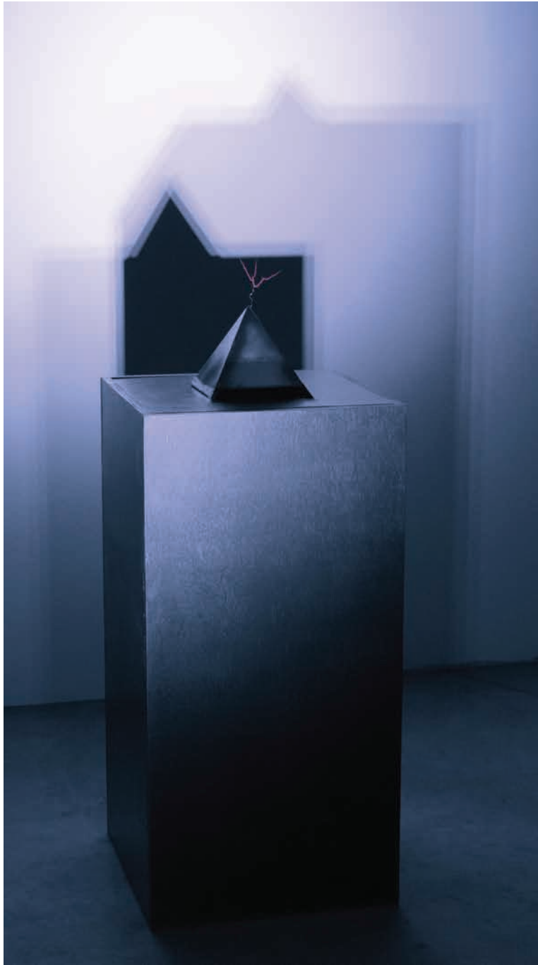
ΝΟΥΣ , 2019 ΞΥΛΟ, ΛΑΜΑΡΙΝΑ, ΠΗΝΙΟ 40 x 40 x 95 εκ.