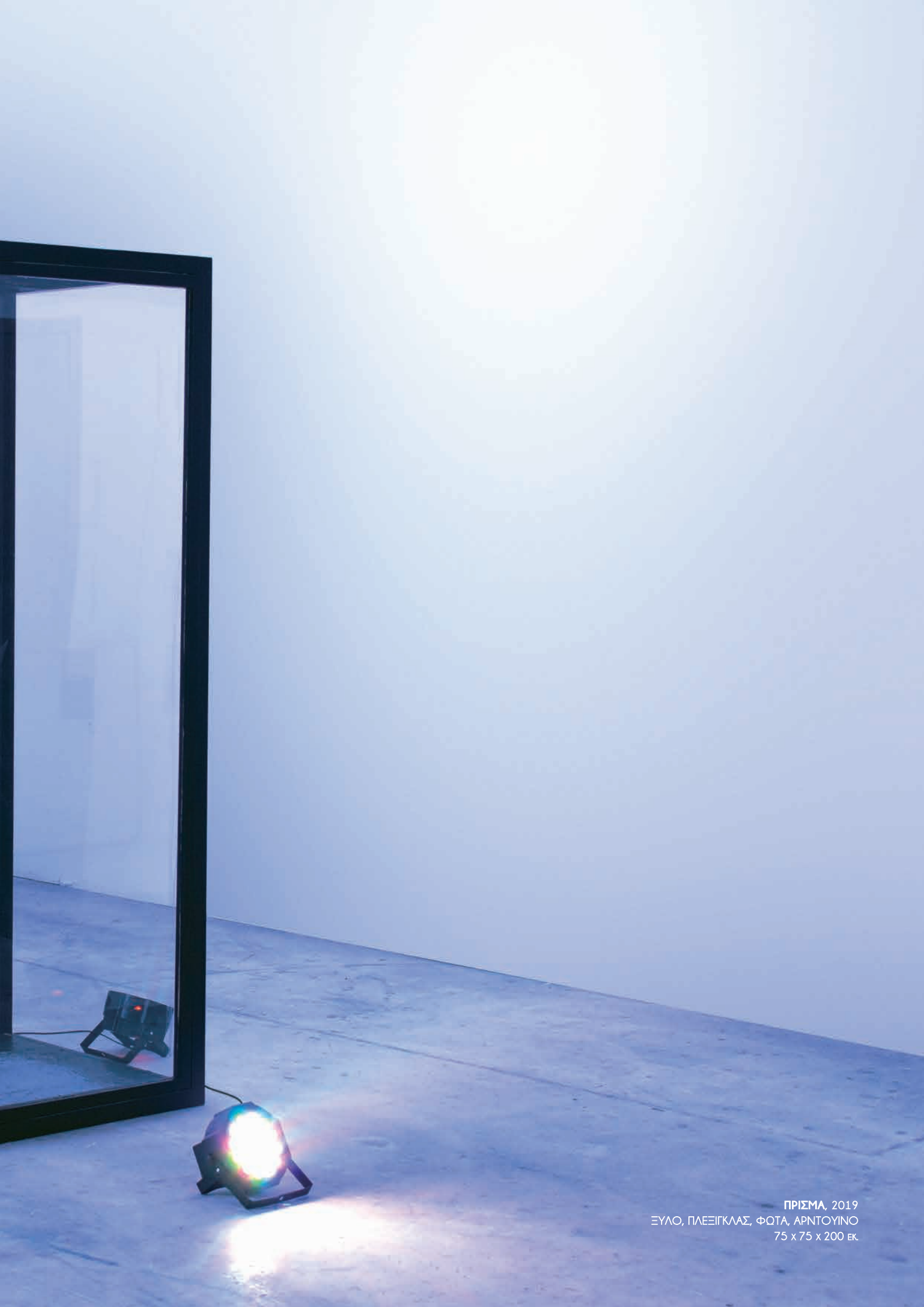
ΠΡΙΣΜΑ, 2019 ΞΥΛΟ, ΠΛΕΞΙΓΛΑΣ, ΦΩΤΑ, ΑΡΝΤΟΥΙΝΟ 75 x 75 x 200 εκ.