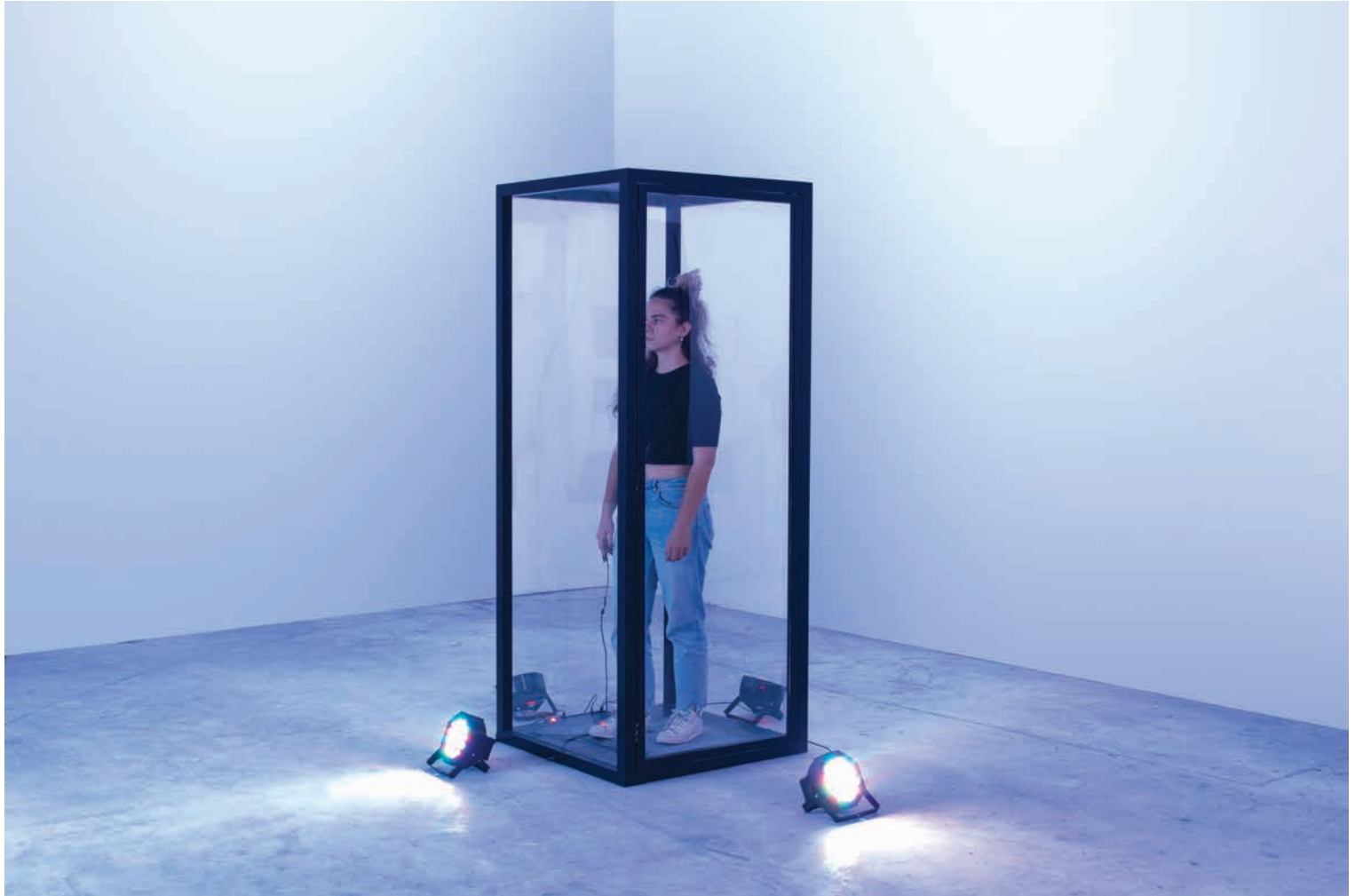
ΠΡΙΣΜΑ, ΛΕΠΤΟΜΕΡΕΙΑ , 2019 ΞΥΛΟ, ΠΛΕΞΙΓΚΛΑΣ, ΦΩΤΑ, ΑΡΝΤΟΥΙΝΟ 75 x 75 x 200 εκ.