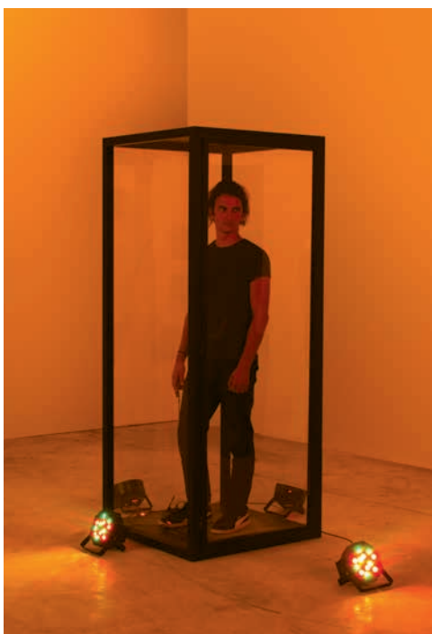
ΠΡΙΣΜΑ, ΛΕΠΤΟΜΕΡΕΙΕΣ, 2019 ΞΥΛΟ, ΠΛΕΞΙΓΚΛΑΣ, ΦΩΤΑ, ΑΡΝΤΟΥΙΝΟ 75 x 75 x 200 εκ.