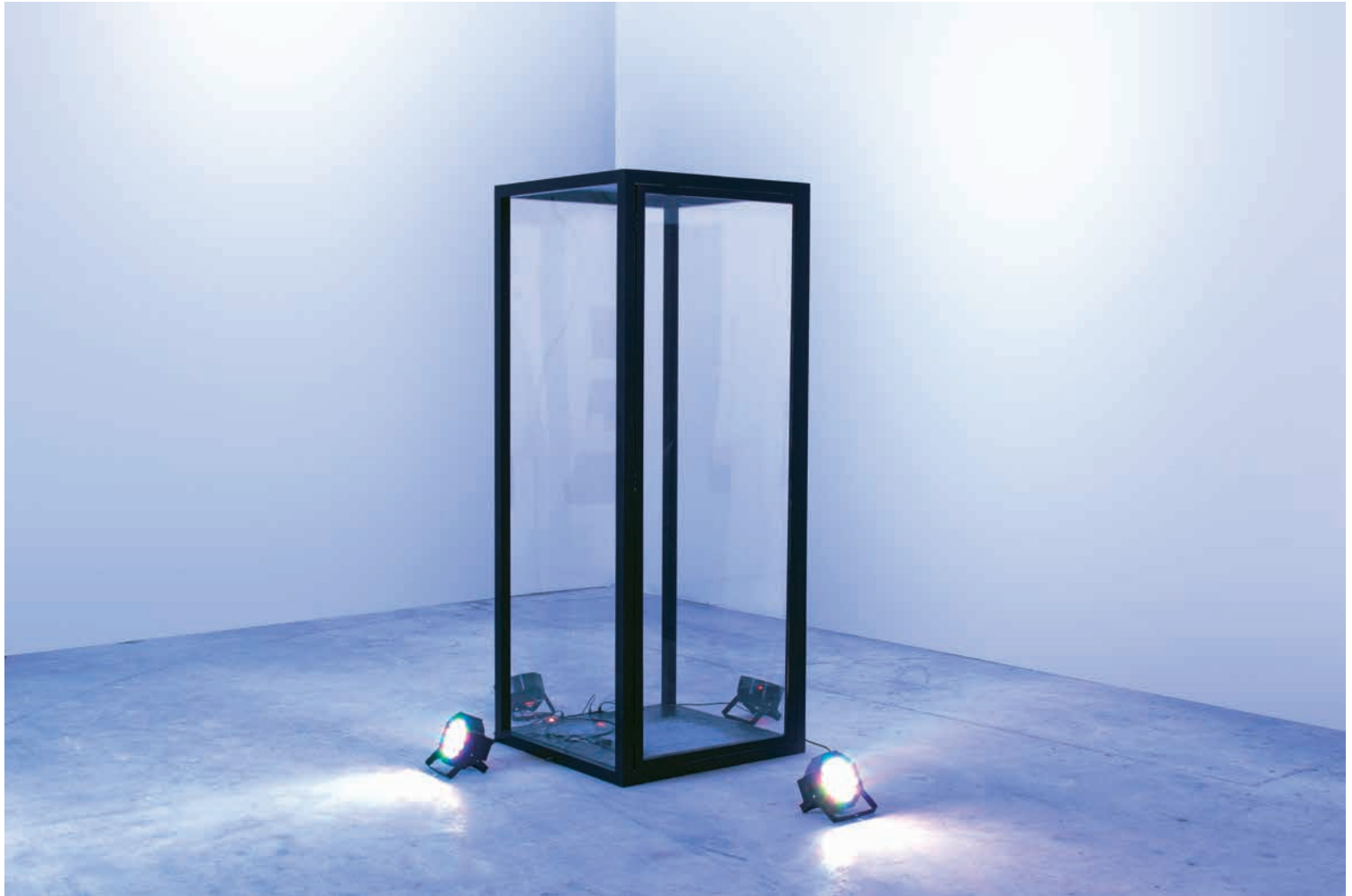
ΠΡΙΣΜΑ , 2019 ΞΥΛΟ, ΠΛΕΞΙΓΚΛΑΣ, ΦΩΤΑ, ΑΡΝΤΟΥΙΝΟ 75 x 75 x 200 εκ.