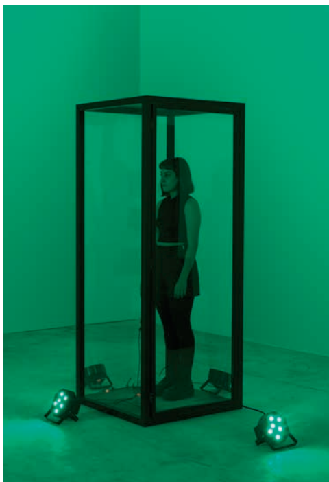
ΠΡΙΣΜΑ, ΛΕΠΤΟΜΕΡΕΙΕΣ, 2019 ΞΥΛΟ, ΠΛΕΞΙΓΚΛΑΣ, ΦΩΤΑ, ΑΡΝΤΟΥΙΝΟ 75 x 75 x 200 εκ.