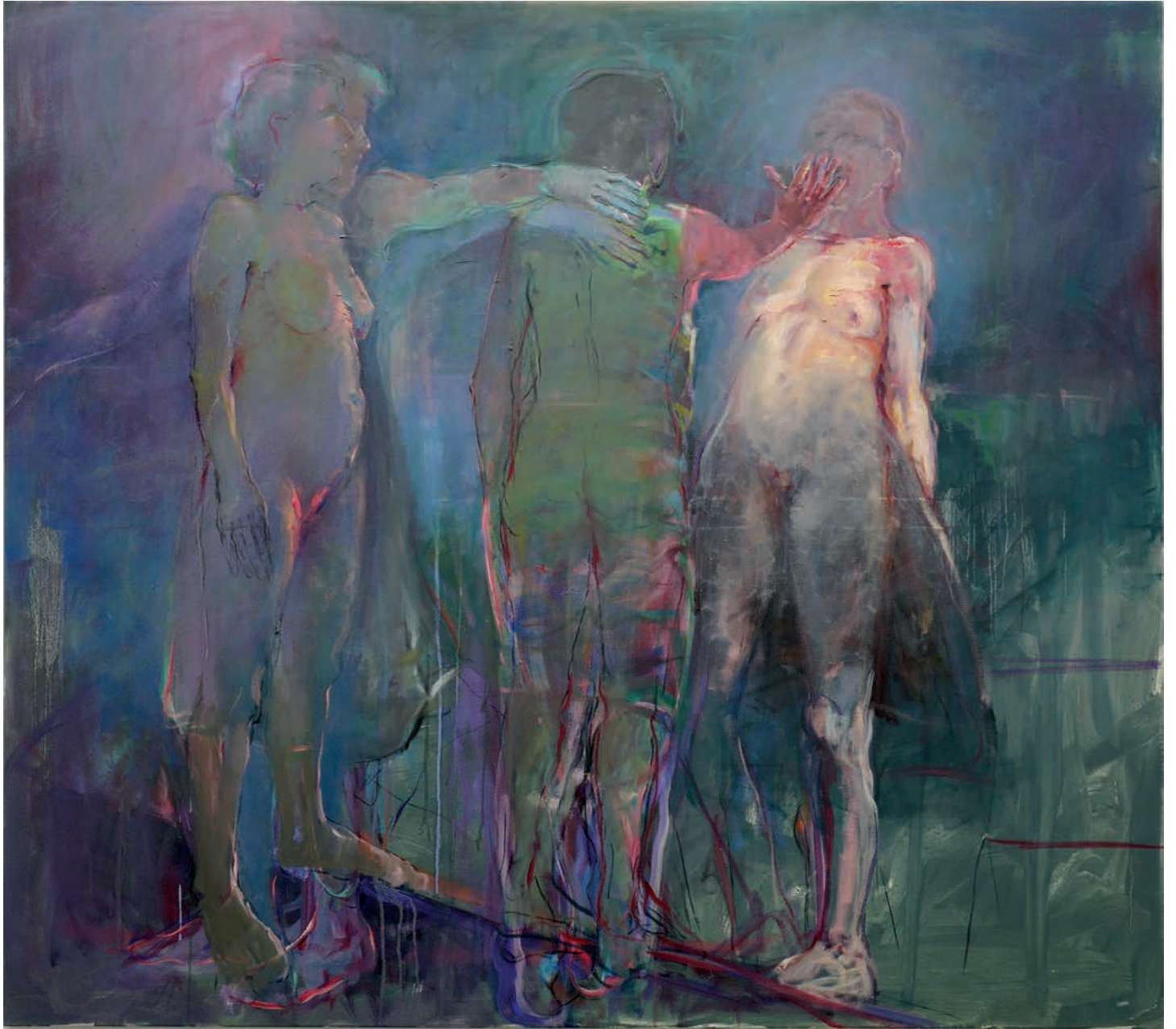
Χορός II 2019, μεικτή τεχνική, λάδι και κάρβουνο σε καμβά, 160 x 180 εκ.