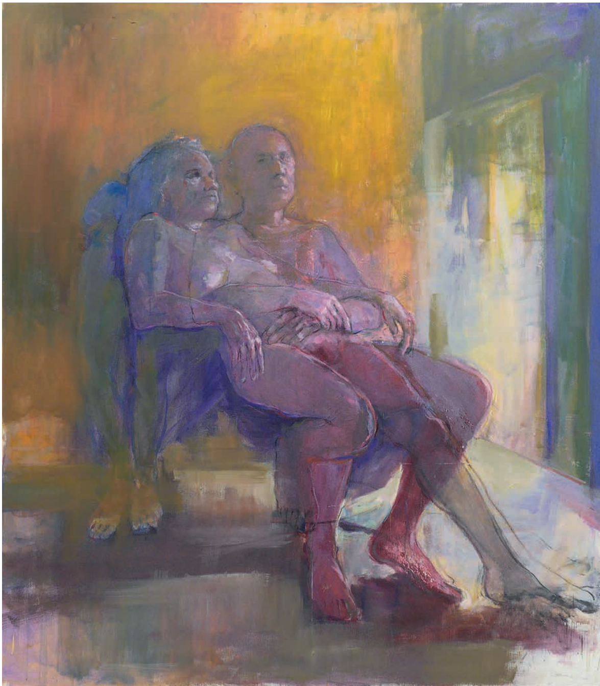
Διπλοτυπία 2019, μεικτή τεχνική, λάδι και κάρβουνο σε καμβά, 180 x 160 εκ.