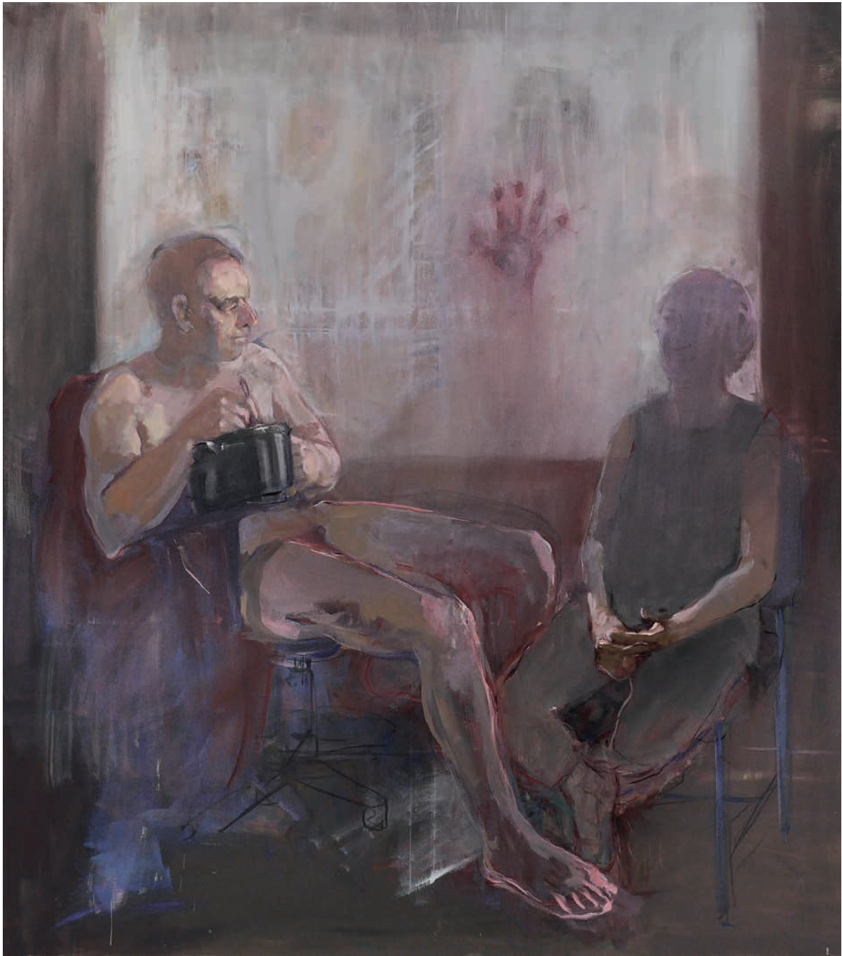
Καλεσμένος 2019, μεικτή τεχνική, λάδι και κάρβουνο σε καμβά, 180 x 160 εκ.