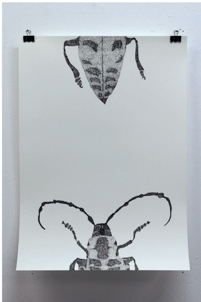
"Heart broke in two", 2020 Πενάκι σε χαρτί, 50X70