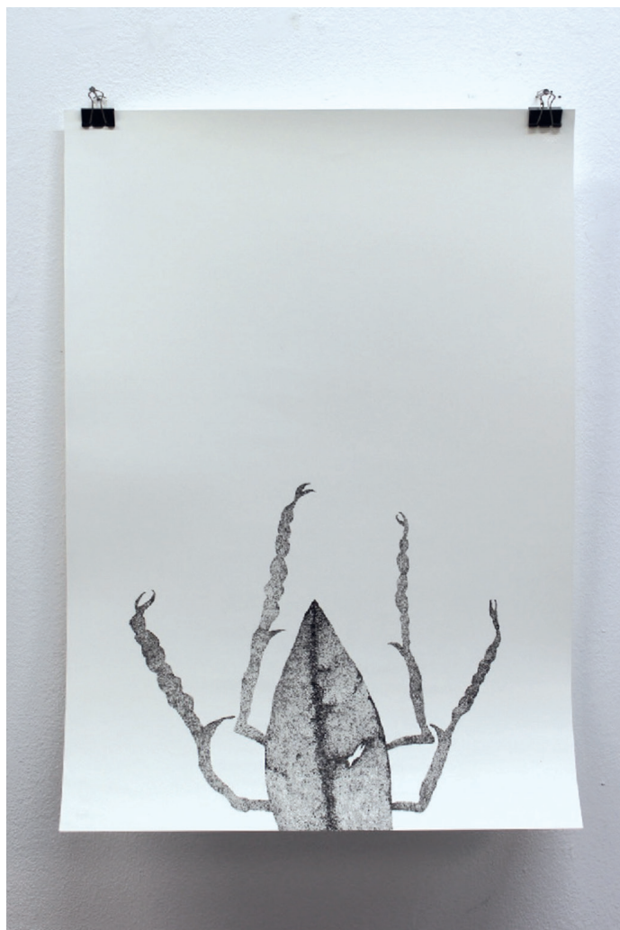
"Halfway there", 2020 Πενάκι σε χαρτί, 50X70