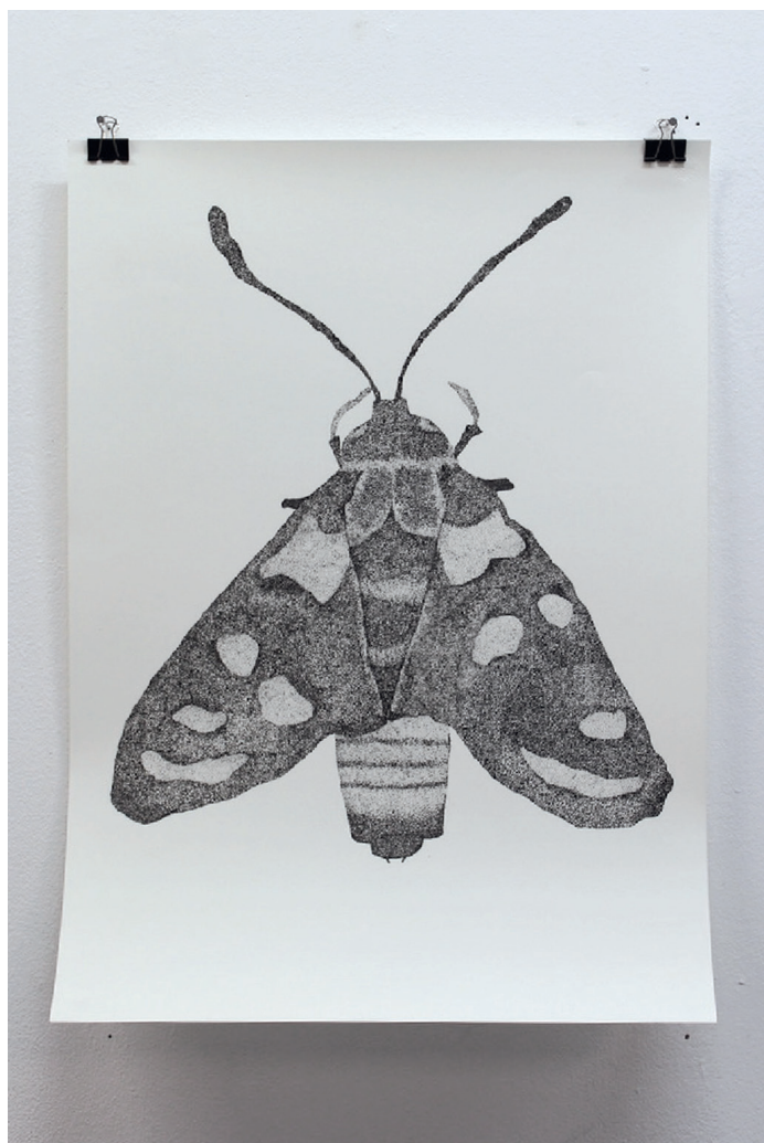
"Around the corner", 2020 Πενάκι σε χαρτί, 50X70